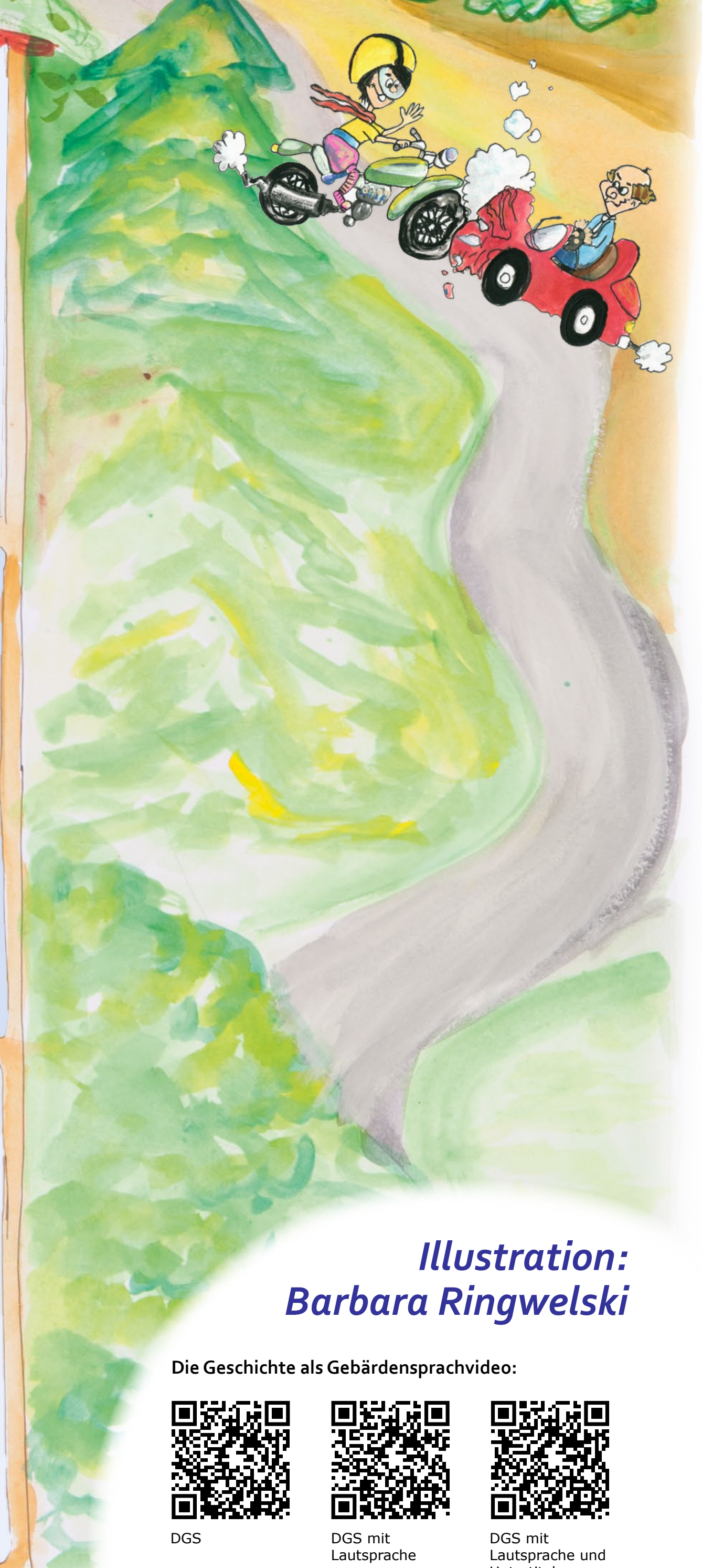
Illustration: Barbara Ringwelski